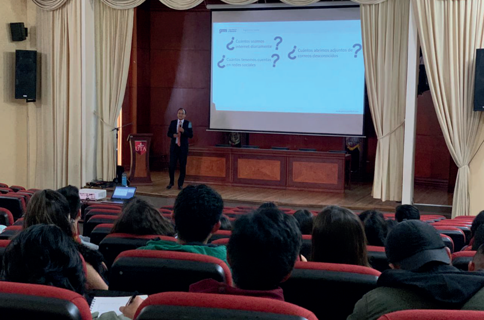
Estudiantes de la Universidad participaron en la Conferencia 'El Arte de Hackear Personas'.